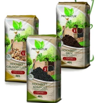
Art.-Nr. 13597, 13601, 13602, 13603